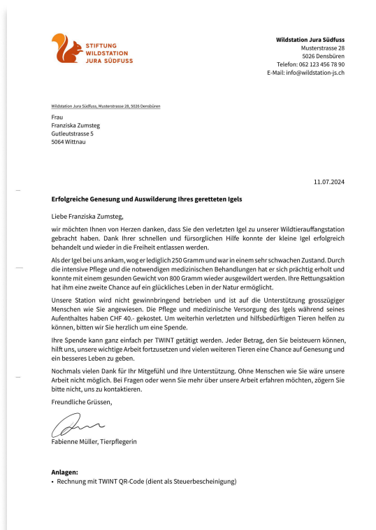
Abb. Beispiel eines Spendenbriefes

Die gezielte Ansprache von Tierfindern ermöglicht es Organisationen, eine tiefere und nachhaltigere Beziehung zu potenziellen Unterstützern aufzubauen. Durch regelmässige Updates über das gerettete Tier und andere Aktivitäten der Organisation wird ein fortlaufender Dialog etabliert. Die direkte Kommunikation ermöglicht es zudem, Transparenz über die Verwendung von Spenden und die Arbeit der Organisation zu schaffen. Tierfinder können in eine engagierte Community eingebunden werden, was das Gefühl der Zugehörigkeit und des gemeinsamen Ziels stärkt.